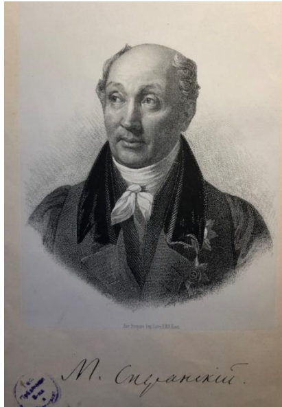
Портрет М.М. Сперанского (1823 г.). Рис. П. Бореля